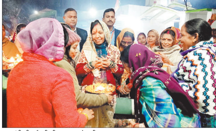
मुख्यमंत्री की धर्मपत्नी की स्वागत करते ग्रामीण।

उन्होंने ग्रामीण बुजुर्ग महिला और कार्यकर्ताओं, बच्चों से मुलाकात कर उनका हाल जाना। और बुजुर्ग सासू मां से आशीर्वाद लेकर गले लगाया। इस दौरान महिलाओं ने बगिया चौक से गृह निवास स्थान तक कलश यात्रा निकाली। उन्होंने वहां पर ग्रामीणों से मुलाकात की और स्वागत सम्मान और प्रेम के लिए धन्यवाद आभार प्रकट किया। इस दौरान