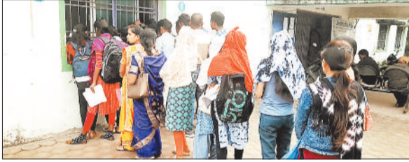
रोजगार कार्यालय में पंजीयन कराने पहुंचे बेरोजगार।

जाजगीर-चापा। जिले में बेरोजगारों की संख्या लगातार बढ़ती जा रही है। रोजगार के अवसर नहीं मिलने के कारण बेरोजगारों का आंकड़ा बढ़ते बढ़ते 1 लाख 49 हजार को पार कर गया है। रोजगार कार्यालय महज बेरोजगारों के पंजीयन तक सिमटकर रह गया है।