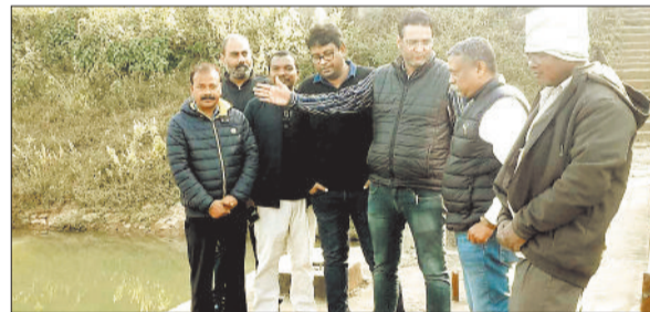
निरीक्षण करते महापौर व अन्य।

इस दौरान मेयर ने जरूरत के हिसाब से बोर करने, किल्लत वाले क्षेत्रों में पानी सप्लाई के लिए वैकल्पिक रूप से व्यवस्था करने, घुनघुटा फिल्टर प्लांट की क्षमता 3 एमएलडी तक बढ़ाने को लेकर