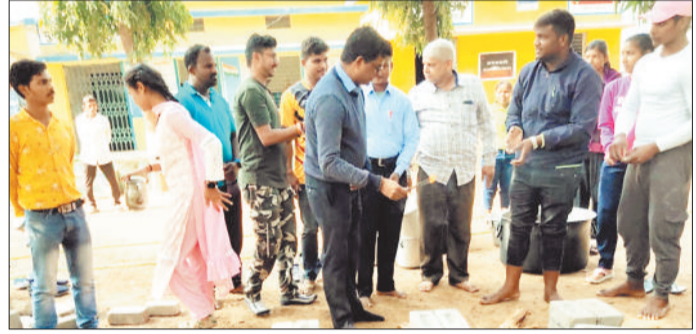
हरिभूमि न्यूज ►► जाजगीर-चापा

जशपुरनगर। चरईडॉड़-बगीचा में चल रहे डामरीकरण सड़क निर्माण कार्य प्रगति पर है। विगत दिनों कलेक्टर डॉ.रवि मित्तल ने निरीक्षण किया था और कार्य के गुणवत्ता की जायजा लेकर लोक निर्माण विभाग के कार्यपालन अभियंता, एसडीएओ, उप अभियंता, ठेकेदार को समय पर सड़क निर्माण के कार्य को पूर्ण करने के निर्देश थे। साथ ही सड़क निर्माण के कार्यों में गुणवत्ता का विशेष ध्यान रखने के लिए कहा था। पीडब्ल्यूडी विभाग के कार्यपालन अभियंता ने बताया कि चरईडॉड़ से बगीचा सड़क निर्माण का कार्य प्रगति पर है। चरईडॉड़ से बगीचा तक डामरीकरण रोड़ निर्माण किया जा रहा है।