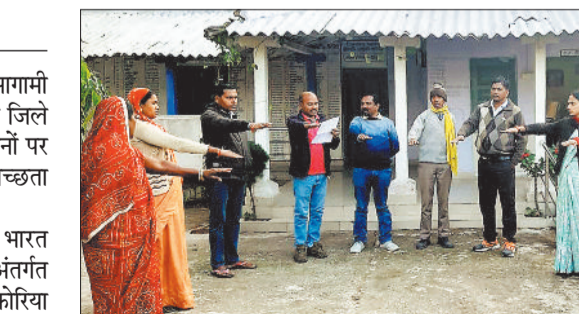
स्वच्छता अभियान के तहत शपथ लेते लोग।